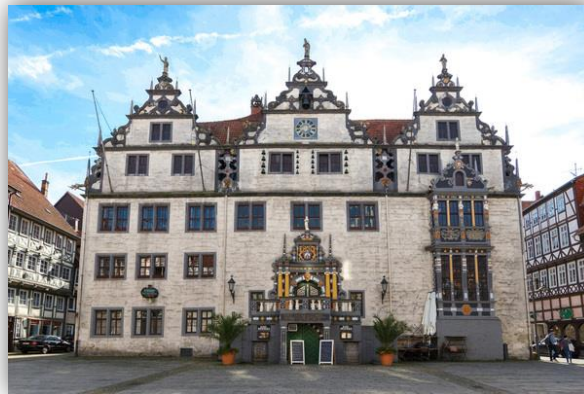
Tourist-Information Hann. Münden