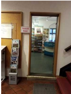
Stufe zum Kundenraum