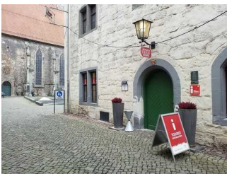
Eingangsbereich Rathaus Seiteneingang