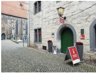
Weg außen Fußgängerzone