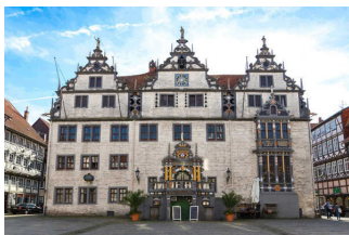
Tourist-Information Hann. Münden