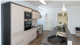
Verbindender Flur Schlafzimmer, großes Badezimmer, Wohnbereich