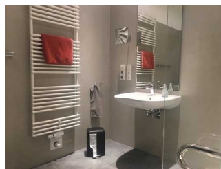
Großes Bad - Waschbecken