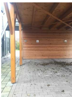
Parkplatz vor dem Haus