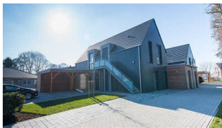
Ferienhaus Hoddersdiek - Wohnung 1