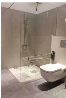
Großes Bad Dusche und WC