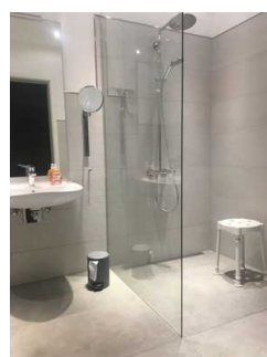
Dusche und Waschbecken