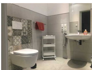
Badezimmer mit Schlafrum 2 verbunden