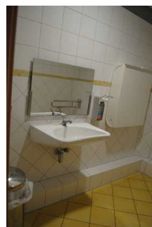
Öffentliches WC im Inselkino