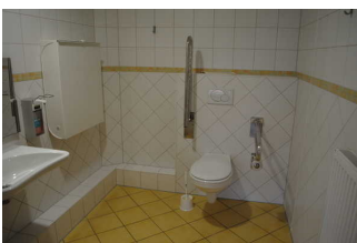
Öffentliches WC im Inselkino