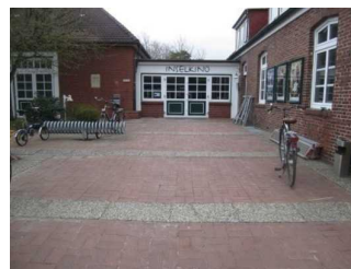
Weg zwischen Strasse und Inselkino Eingang