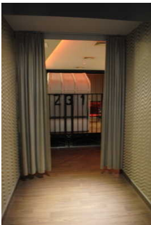
Gang innen zwischen Saaltüre und Raum