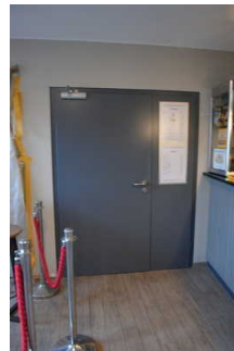
Tür zwischen Foyer und Gang zum Saal