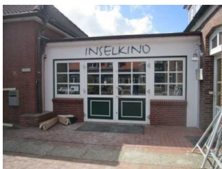
Eingang Inselkino Joke Pouliart