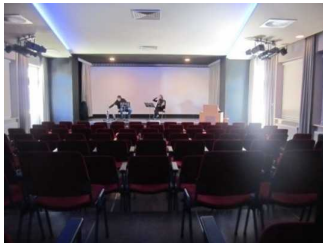
Bild von Inselkino der Nordseebad Spiekeroog