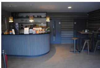
Tresen/Kasse im Inselkino