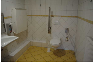
Öffentliches WC im Inselkino