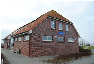
Kennzeichnung der Gebäude

Es sind Informationen vorhanden, die der Orientierung dienen und aus Wörtern bestehen. Informationen zur Orientierung sind in leichter Sprache verfügbar.