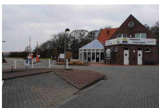
Weg Parkplatz zur Anmeldung und Eingang Campingplatz