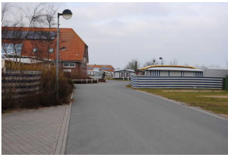
Weg zum Sanitärgebäude