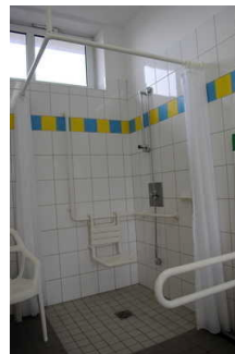
Dusche im Sanitärbereich

Es ist kein Alarmauslöser (Schnur, Knopf) vorhanden.