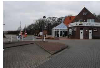
Nordsee- Campingplatz Neuharlingersiel