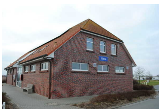
Kennzeichnung der Gebäude

Es sind Informationen vorhanden, die der Orientierung dienen und aus Wörtern bestehen.