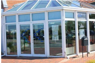
Eingang Anmeldung Rezeption

Name bzw. Logo des Betriebes/der Einrichtung sind von außen klar erkennbar.