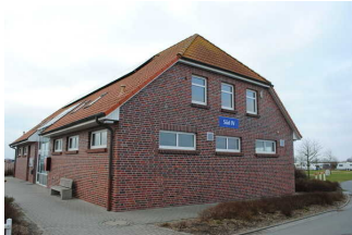
Kennzeichnung der Gebäude

Es sind Informationen vorhanden, die der Orientierung dienen und aus Wörtern bestehen. Informationen zur Orientierung sind in leichter Sprache verfügbar.