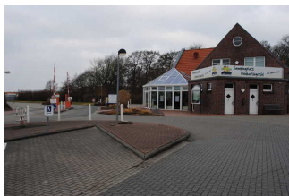
Weg Parkplatz zur Anmeldung und Eingang Campingplatz