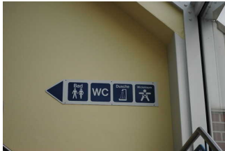
Mantelbogen visuell taktile Gestaltung