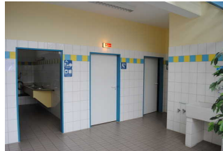
Mantelbogen visuell taktile Gestaltung