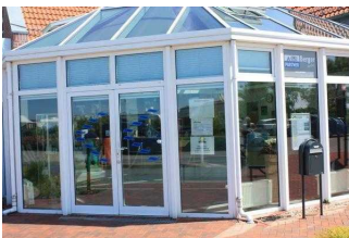
Eingang Anmeldung Rezeption

Name bzw. Logo des Betriebes/der Einrichtung sind von außen klar erkennbar.