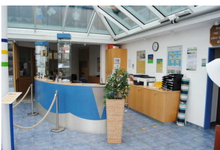
Anmeldung / Rezeption Campingplatz