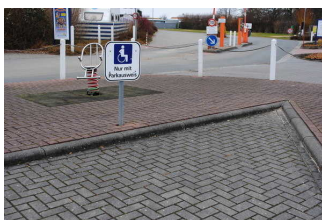
Parkplatz für Menschen mit Behinderung vor der Zufahrt / Rezeption