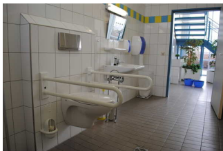
Sanitärbereich für Menschen mit Behinderung