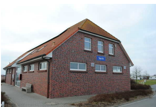
Kennzeichnung der Gebäude

Es sind Informationen vorhanden, die der Orientierung dienen und aus Wörtern bestehen.