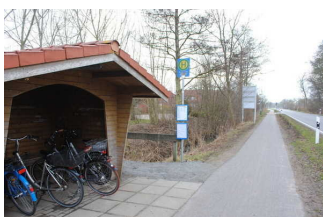
Weg von der Haltestelle zum Campingplatzgelände