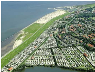
Nordsee- Campingplatz Neuharlingersiel