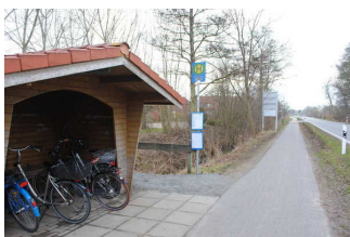
Weg von der Haltestelle zum Campingplatzgelände

Weder ist das Ziel des Weges in Sichtweite, noch gibt es ein unterbrechungsfreies Wegeleitsystem oder Wegezeichen in sichtbarem Abstand.