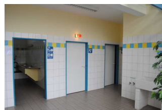
Foyer / Sanitärgebäude