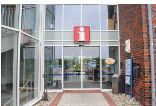
Eingang für Menschen mit Behinderung