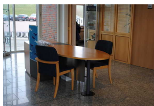
Besprechungsbereich in der Halle neben dem Schalterbereich