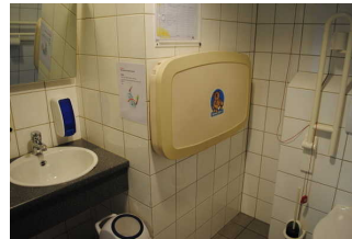
Waschbecken und Wickeltisch