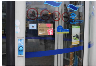
Nutzung Rotationstür für Rollstuhlfahrer