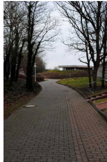
Weg von Bushaltestelle zu Haupteingang TI

Die Bushaltestelle "Campingplatz" ist die nächstgelegene Haltestelle zur Tourist-Information Neuharlingersiel sowie Kuranlagen und Schwimmbad. Die Haltestelle ist bildlich gekennzeichnet, verfügt über schriftliche Fahrplaninformationen und bietet Sitzgelegenheiten. Der Weg von der Haltestelle zum Haupteingang ist ca. 300 m lang und 180 cm breit. Von der Oberflächenbeschaffenheit her ist er leicht begeh- bzw. befahrbar.