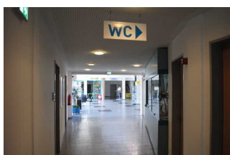
Flur von Raum Tourist-Information zur öffentlichen Toilette für