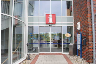
Eingang für Menschen mit Behinderung