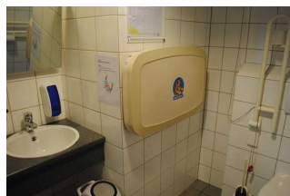
Waschbecken und Wickeltisch

Anmerkungen für den Gast: Es ist ein Wickeltisch (für Kleinkinder) vorhanden.