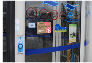
Nutzung Rotationstür für Rollstuhlfahrer

Name bzw. Logo des Betriebes/der Einrichtung sind von außen klar erkennbar.