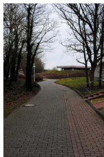
Weg von Bushaltestelle zu Haupteingang TI

Die Bushaltestelle "Campingplatz" ist die nächstgelegene Haltestelle zur Tourist-Information Neuharlingersiel sowie Kuranlagen und Schwimmbad. Die Haltestelle ist bildlich gekennzeichnet, verfügt über schriftliche Fahrplaninformationen und bietet Sitzgelegenheiten. Der Weg von der Haltestelle zum Haupteingang ist ca. 300 m lang und 180 cm breit. Von der Oberflächenbeschaffenheit her ist er leicht begeh- bzw. befahrbar.