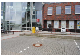
Parken für Menschen mit Behinderung vor der Tourist-Information