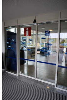
Eingang Windfang zwei Automattüren in Folge

Name bzw. Logo des Betriebes/der Einrichtung sind von außen klar erkennbar.