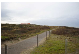
Weg außen von der Touristenformation "Kogge" zum Strand