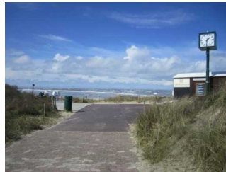
Weg vom öffentlichen WC zum Hauptbadestrand