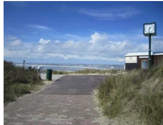
Weg vom öffentlichen WC zum Hauptbadestrand