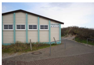
Öffentliches WC am Hauptbadestrand (Höhe Strandhalle), Aussenansicht