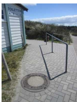
Weg zum öffentlichen WC am Hauptbadestrand