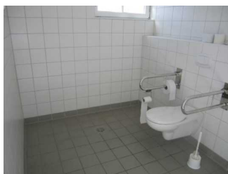
Toilette im Öffentlichen WC am Hauptbadestrand (Höhe Strandhalle)