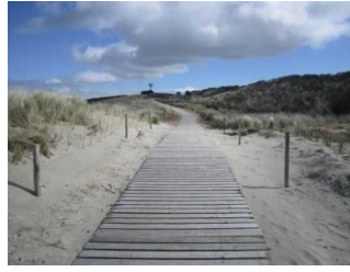
Zuwegung von der Düne/ Hauptbad zum Strand