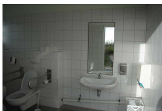
Waschbecken Öffentliches WC am Hauptbadestrand (Höhe Strandhalle)