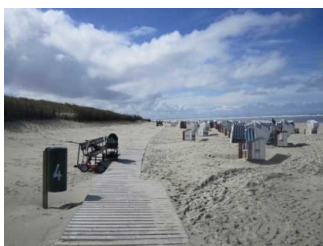
Strand und Wege am Hauptbad