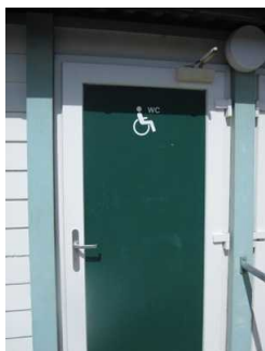
Weg zum öffentlichen WC am Hauptbadestrand