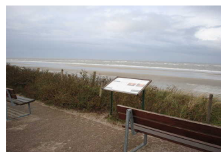
Weg außen von der Touristenformation "Kogge" zum Strand