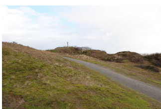
Weg außen von der Touristenformation "Kogge" zum Strand