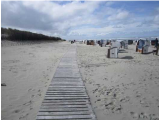
Bohlenweg am Strand