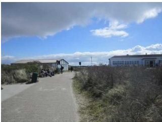
Weg vom öffentlichen WC zum Hauptbadestrand