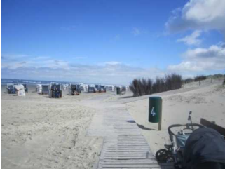
Wege am Strand und Aufgang zum Hauptbad