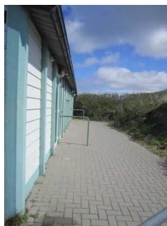
Weg zum öffentlichen WC am Hauptbadestrand