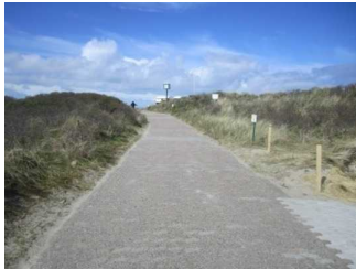
Weg vom öffentlichen WC zum Hauptbadestrand