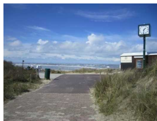
Weg vom öffentlichen WC zum Hauptbadestrand