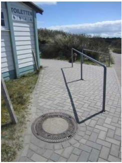
Weg zum öffentlichen WC am Hauptbadestrand