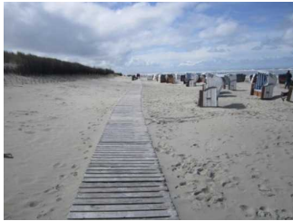
Bohlenweg am Strand