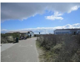
Weg vom öffentlichen WC zum Hauptbadestrand