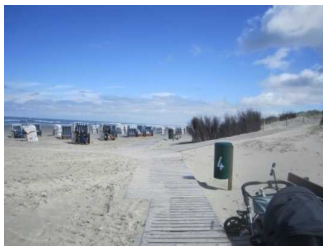
Wege am Strand und Ausgang zum Hauptbad