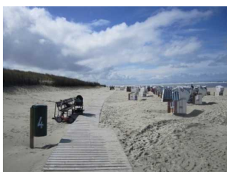
Strand und Wege am Hauptbad