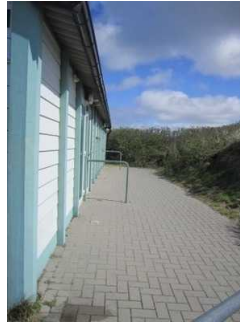
Weg zum öffentlichen WC am Hauptbadestrand