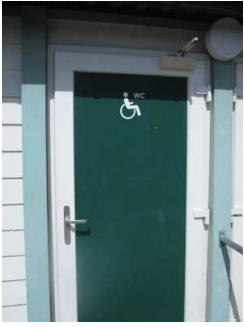
Weg zum öffentlichen WC am Hauptbadestrand