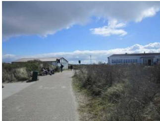
Weg vom öffentlichen WC zum Hauptbadestrand