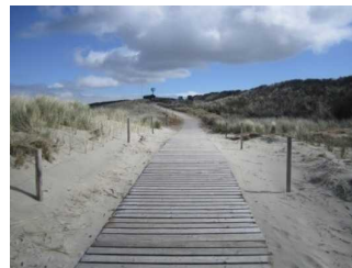
Zuwegung von der Düne/ Hauptbad zum Strand