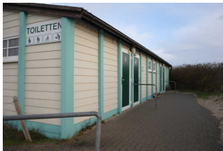
Mantelbogen visuell taktile Gestaltung