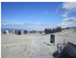
Wege am Strand und Aufgang zum Hauptbad