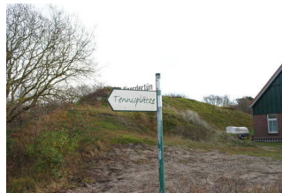
Mantelbogen visuell taktile Gestaltung