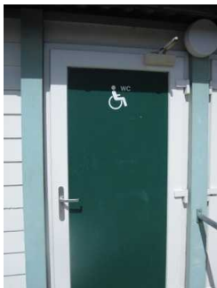
Weg zum öffentlichen WC am Hauptbadestrand