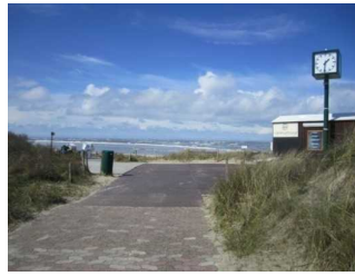
Weg vom öffentlichen WC zum Hauptbadestrand