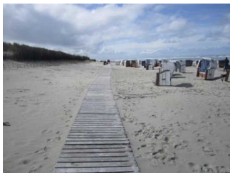
Bohlenweg am Strand