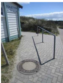
Weg zum öffentlichen WC am Hauptbadestrand