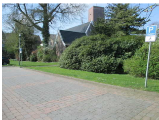
Parkplatz am Dränkweg

Es ist kein betriebseigener Parkplatz vorhanden.