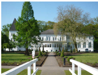
Altes Kurhaus von der Meerseite