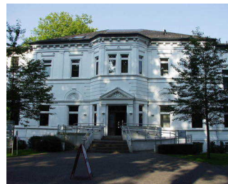
Altes Kurhaus mit Eingangsbereich