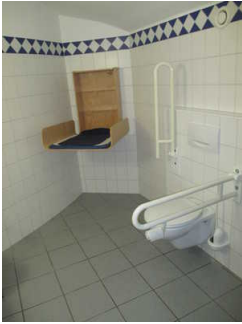
WC für Menschen mit Behinderung und Wickeltisch