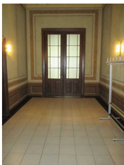
Flur vom Eingang des Alten Kurhauses zum Spiegelsaal (Veranstaltungsraum)