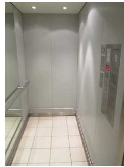
Aufzug zu den Toiletten (UG)

Der Aufzug ist hell und blendfrei ausgeleuchtet.