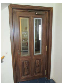
Tür vom Flur (oben) zum Treppenhaus