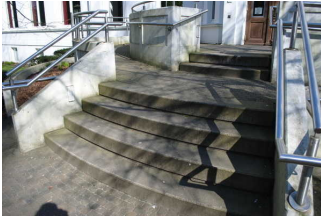
Treppe zum Eingang Altes Kurhaus