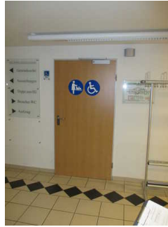
Tür zum Sanitärraum für Menschen mit Behinderung