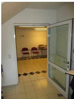
Tür vom Flur (unten) zum Treppenhaus