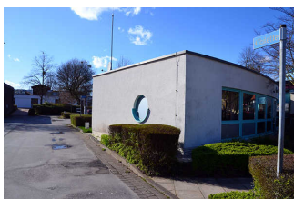
Weg zum WC (ab Parkplatz)