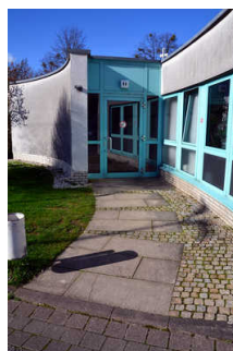
Weg zum WC (ab Parkplatz)