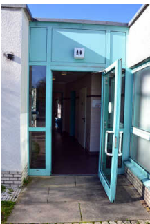
Automatische Tür zum WC-Flur