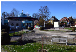
Touristinformation Bad Pyrmont