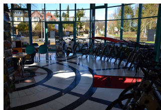
Raum Tourist Information