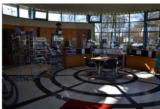
Raum Tourist Information