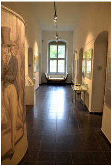
Ausstellung im EG