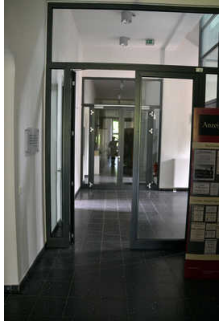
Tür zu Ausstellungsräumen im EG