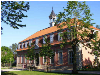
Romantik Bad Rehburg