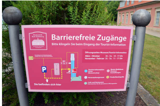
Mantelbogen visuell taktile Gestaltung