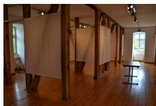
Ausstellung im OG