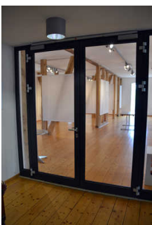
Ausstellung im OG