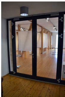
Tür zu Ausstellungsräumen im OG