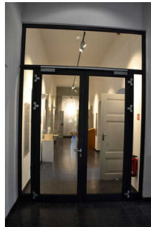
Ausstellung im EG