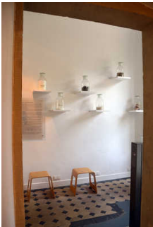
Ausstellung im EG