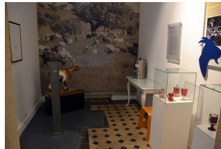
Ausstellung im EG