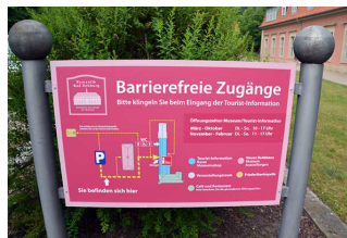
Weg vom Parkplatz zur Tourist- Information