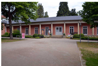
Weg vom Parkplatz zur Tourist- Information