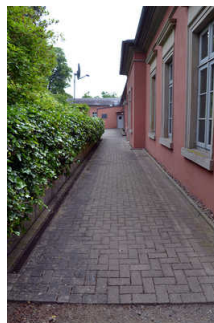
Weg zum barrierefreien Hintereingang der Tourist-Info