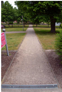
Weg vom Parkplatz zur Tourist- Information