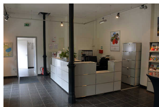
Tresen in der Tourist-Information