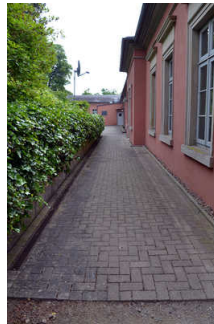
Weg zum barrierefreien Hintereingang der Tourist-Info