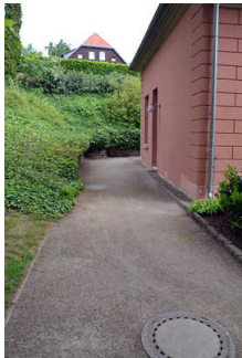
Weg zum barrierefreien Hintereingang der Tourist-Info