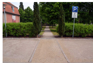
Parkplatz Romantik Bad Rehburg und Tourist-Information