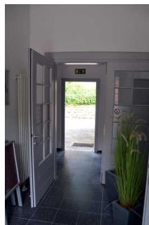
Flur zwischen Haupteingangstür und Tür zur Tourist-Information