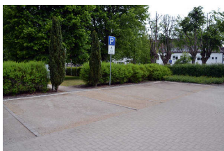
Parkplatz Romantik Bad Rehburg und Tourist-Information