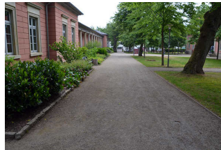
Weg vom Parkplatz zur Tourist- Information