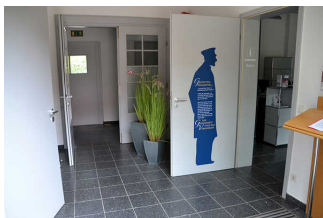
Flur zwischen Haupteingangstür und Tür zur Tourist-Information