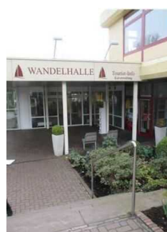
Bild von Eingangsbereich