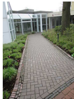
Rampe von Gehweg zu Eingang Wandelhalle