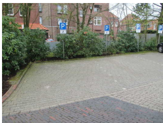
Stellplätze für Menschen mit Behinderung