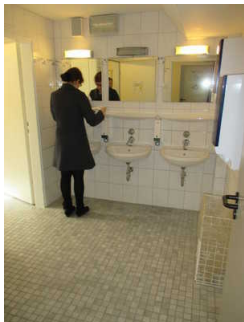
Vorraum öffentliches WC Herren