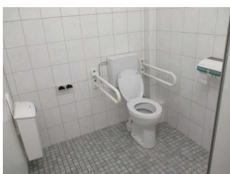
Kabine öffentliches WC Damen