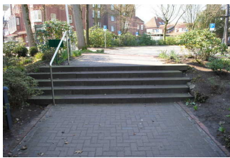
Stufen auf dem Weg vom Parkplatz zum Eingang