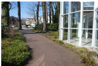
Rampe auf dem Weg vom Parkplatz zum Eingang