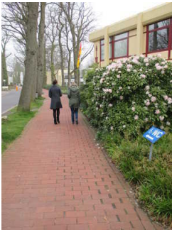
Weg zur Wandelhalle