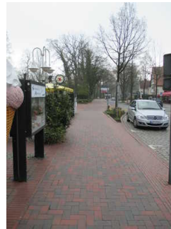
Weg zur Wandelhalle