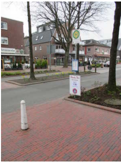
Bushaltestelle "Auf dem Hohen Ufer"