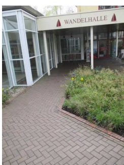
Rampe von Gehweg zu Eingang Wandelhalle