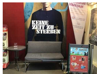
Kasse und Verkaufstresen