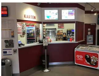
Kasse und Verkaufstresen