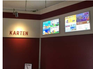
Mantelbogen visuell taktile Gestaltung