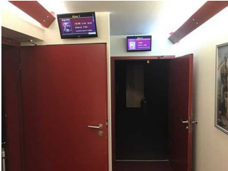
Mantelbogen visuell taktile Gestaltung