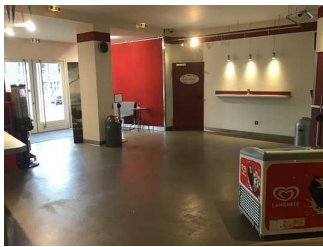
Foyer mit Kasse