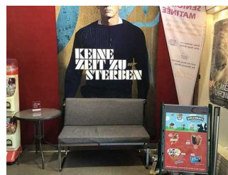
Kasse und Verkaufstresen