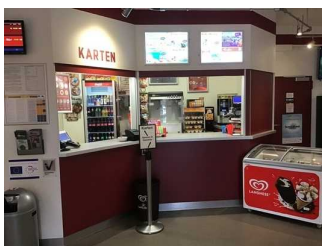
Kasse und Verkaufstresen