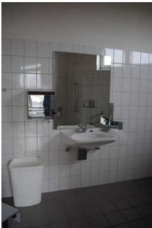
Sanitärraum 2 für Menschen mit Behinderung