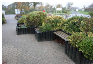
Weg von der Rezeption zum Sanitärgebäude 1