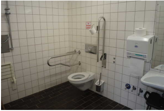
Sanitärraum für Menschen mit Behinderung