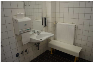
Sanitärraum für Menschen mit Behinderung