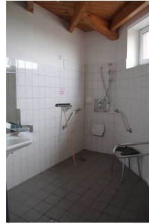
Sanitärraum 2 für Menschen mit Behinderung