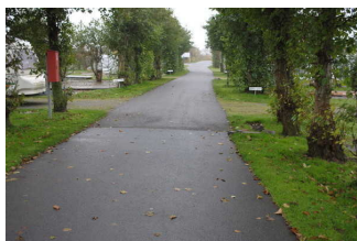
Weg außen vom Hundebereich zum Sanitärgebäude 2