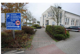
Weg vom Parkplatz für Menschen mit Behinderung zur Rezeption