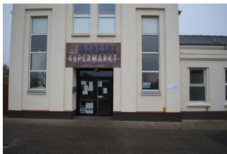
Tresen/Kasse im Shop