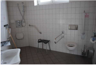
Sanitärraum 2 für Menschen mit Behinderung