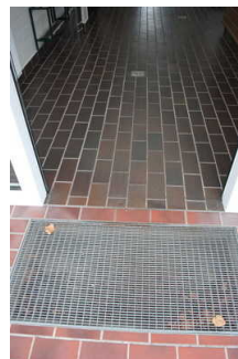
Eingangsbereich Sanitärgebäude 1