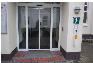
Eingangsbereich Sanitärgebäude 1