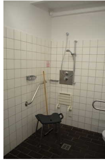
Sanitärraum für Menschen mit Behinderung