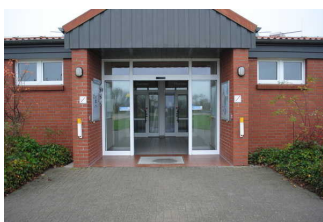
Eingangsbereich Sanitärgebäude 2