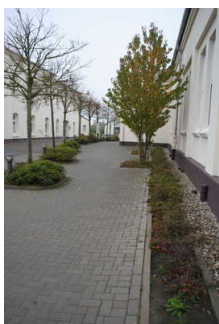
Weg von der Rezeption zum Sanitärgebäude 1