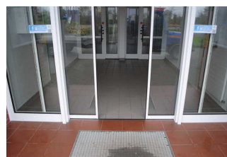
Eingangsbereich Sanitärgebäude 2