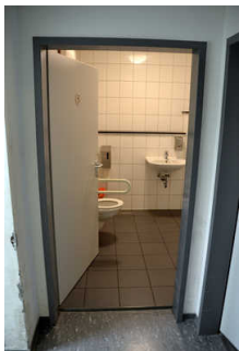
Öffentliches WC Fußgängerzone Stadtbücherei