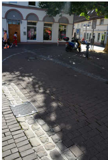
Fußgängerzone am Markt