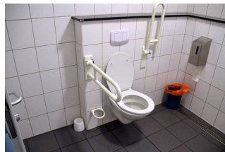
Öffentliches WC Fußgängerzone Stadtbücherei