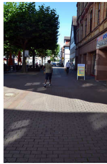
Fußgängerzone am Markt