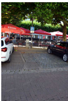
Parkplatz am Markt