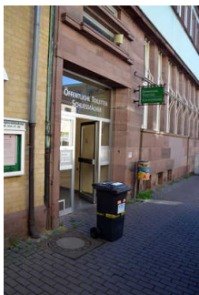
Tür von Fußgängerzone zum WC-Flur