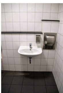
Öffentliches WC Fußgängerzone Stadtbücherei