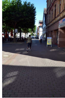
Fußgängerzone am Markt