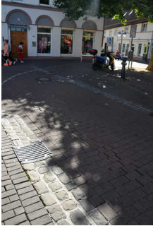
Fußgängerzone am Markt