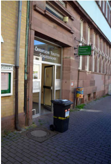
Tür von Fußgängerzone zum WC-Flur