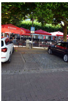
Parkplatz am Markt