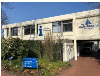
Außenansicht Tourist-Information Bad Zwischenahn