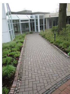
Rampe von Gehweg zu Eingang Tourist-Information