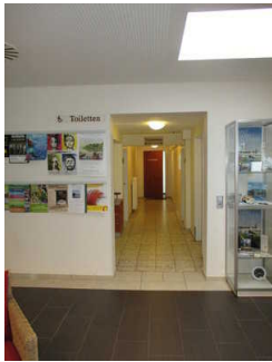
Flur zu den Toiletten