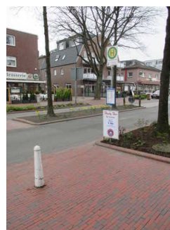
Bushaltestelle "Auf dem Hohen Ufer"

Entfernung der Haltestelle für Menschen mit Behinderung zum Eingangsbereich: 100 m