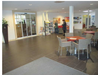
Foyer 1 (Weg zu den Toiletten)