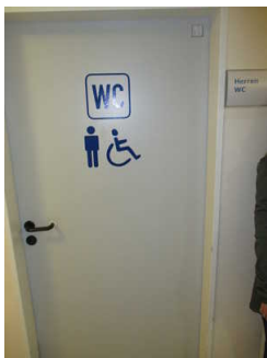
Öffentliches WC - Herren