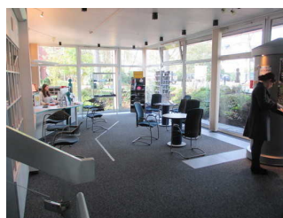
Tresen Tourist- Information

BREITE der Bewegungsfläche vor dem Schalter/Tresen/der Kasse: 185 cm