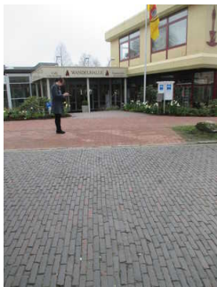
Weg Parkplatz bis Eingang Tourist- Information