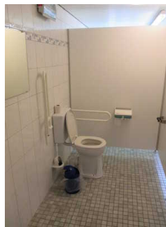
Kabine WC für Menschen mit Behinderung (Herren)