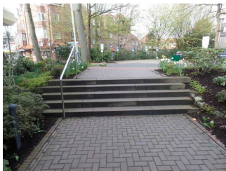
Treppe vom Gehweg zum Eingang Tourist- Information

Treppe vom Gehweg zum Eingang Tourist-Information