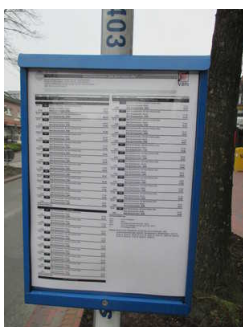
Bushaltestelle "Auf dem Hohen Ufer"