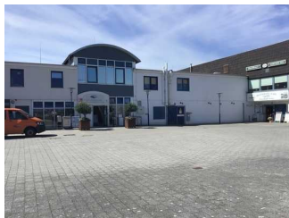
Parkplatz vor der TI