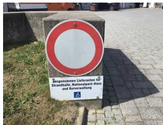
Parkplatz vor der TI