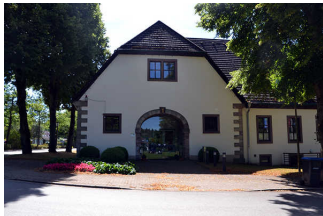
Touristikzentrum Solling-Vogler- Region