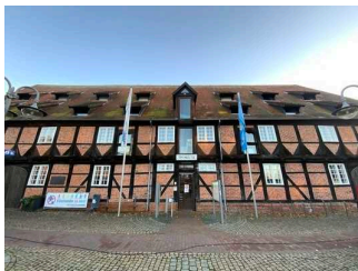
Tourist-Information Winsener Elbmarsch