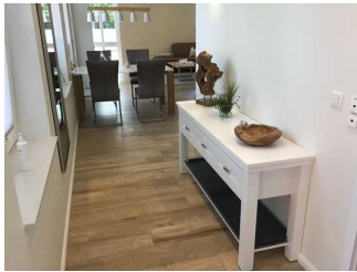
Wege in der Wohnung