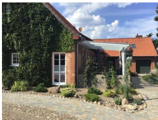
Hof Cordes - Ferienwohnung Taubenschlag