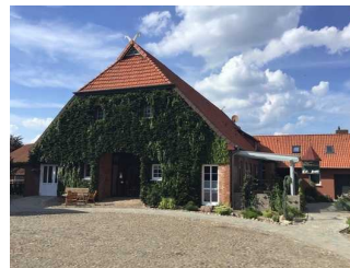
Hof Cordes - Ferienwohnung Taubenschlag