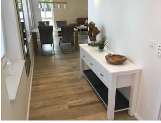
Wege in der Wohnung