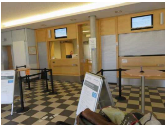
Fahrkartenschalter / Warteraum