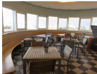
Fahrkartenschalter / Warteraum