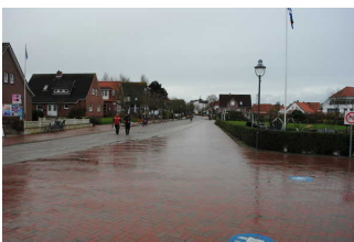
Weg vom Bahnsteig ins Dorf

Das Ziel des Weges ist nicht in Sichtweite, es gibt kein unterbrechungsfreies Wegeleitsystem und die Wegezeichen sind nicht in ständig sichtbarem Abstand.