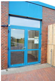
Eingang Erlebnisbad Langoog

Name und Logo des Betriebes/der Einrichtung sind von außen klar erkennbar.