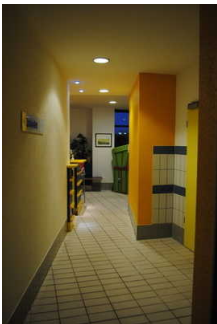
Weg vom Eingang zum Saunabereich