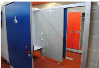
Umkleide für Menschen mit Behinderung