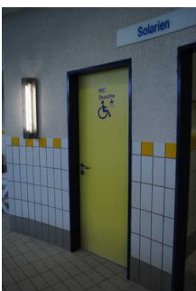
Auf dem Weg in der Schwimmhalle zwischen Nassbereich, Umkleiden und dem Saunabereich die Dusche und WC