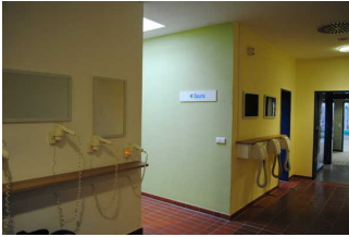
Flur zur Sauna