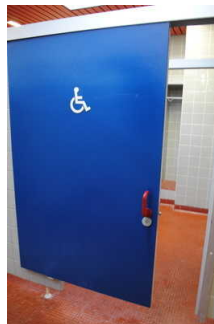
Tür zur Umkleide für Menschen mit Behinderung

Haltegriffe auf 100 cm Höhe Kleiderhaken auf 160 cm Höhe