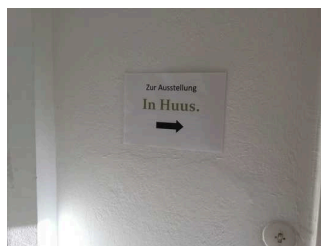
Bedienelemente / Leitsystem