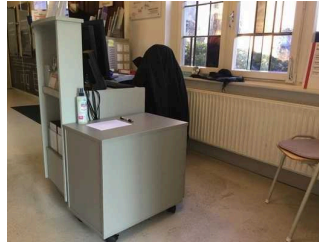
Dokumentationsstätte Gnadenkirche Tidofeld