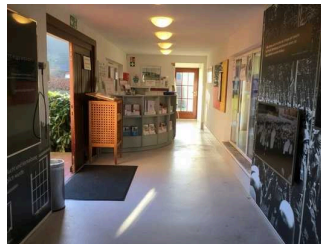
Kasse / Ticketschalter