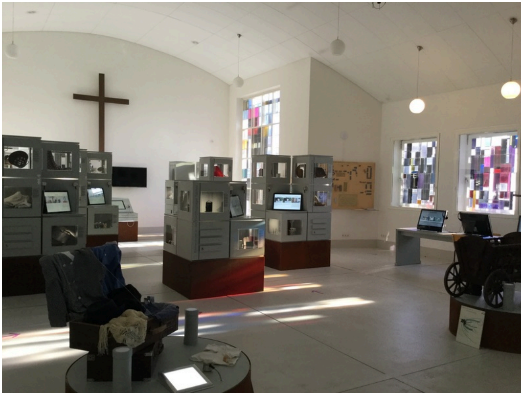
Dokumentationsstätte Gnadencirche Tidofeld