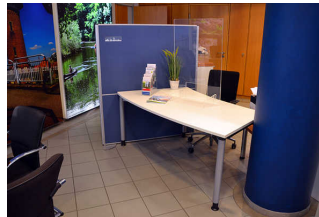
Schalter in der Tourist-Information Lingen