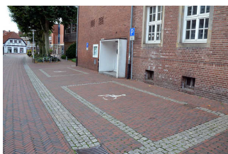
Parkplatz für Menschen mit Behinderungen am Neuen Rathaus