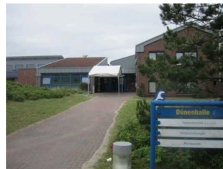
Weg von der Straße zur Dünenhalle