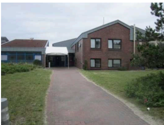
Weg von der Straße zur Dünenhalle