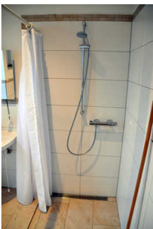
WC, Dusche, Waschraum