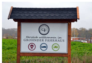
Bedienelemente / Leitsystem