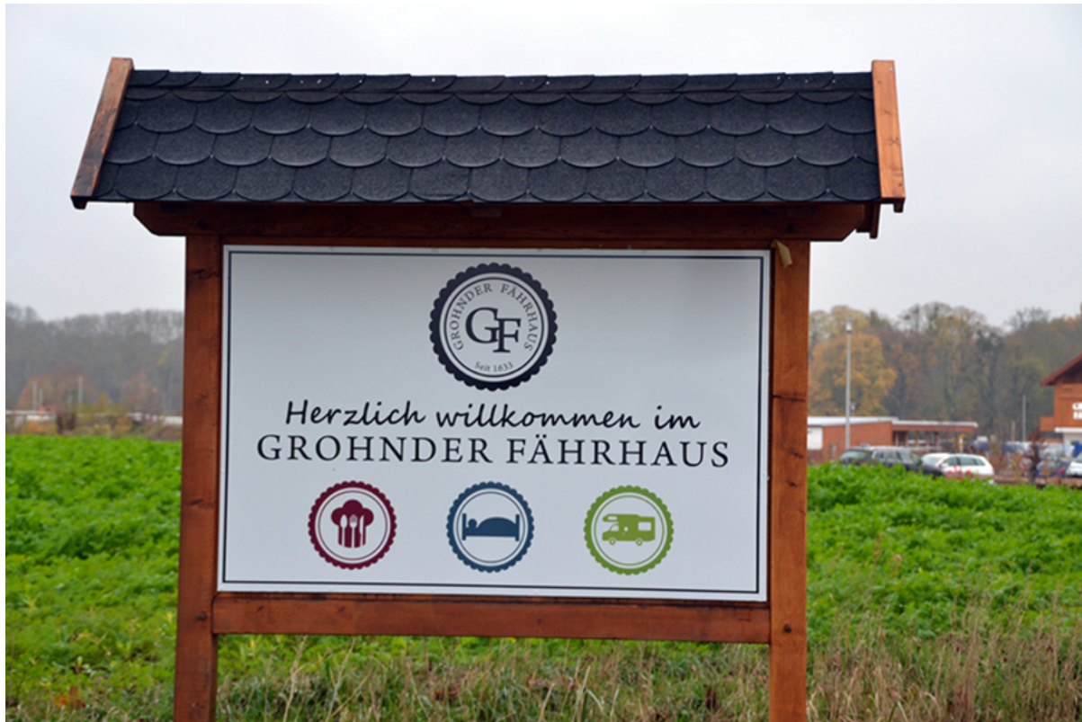
Grohnder Fährhaus – Campingplatz