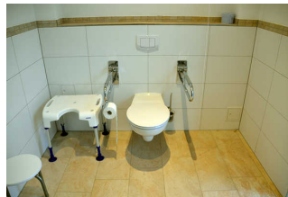
WC, Dusche, Waschraum