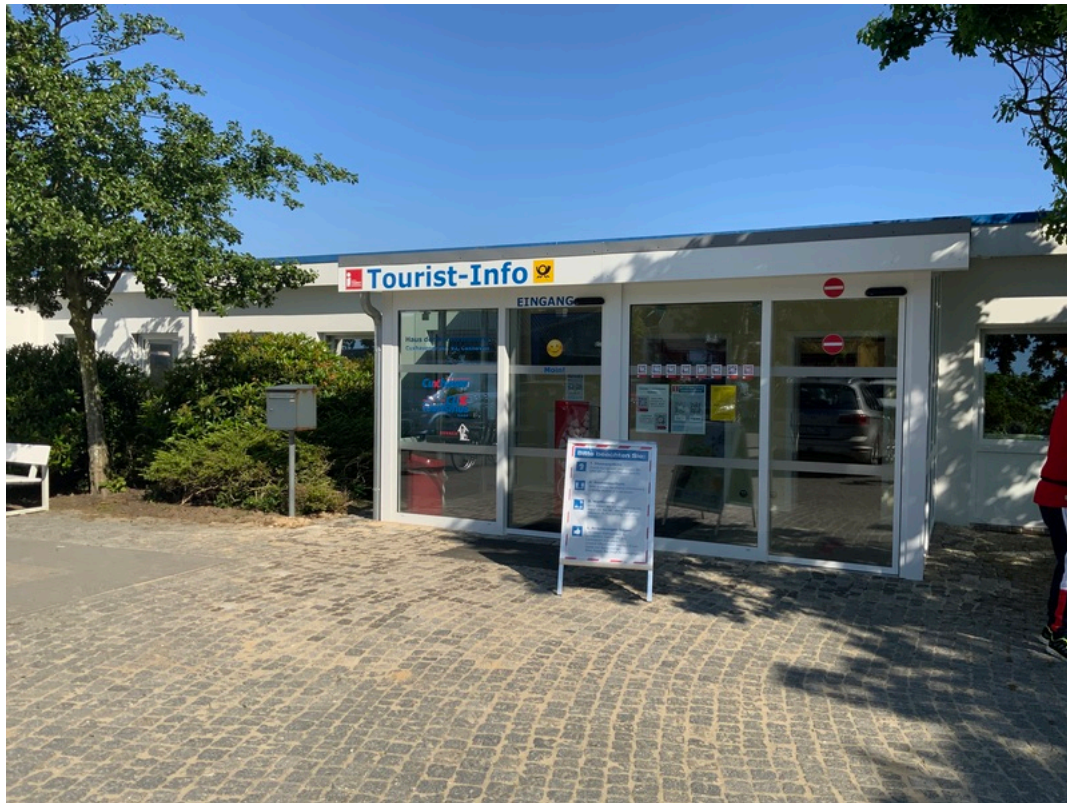
Touristinformation Duhnen