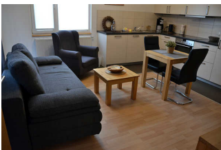
Wohnraum mit Küchenzeile