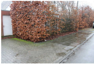
Weg außen – Parken