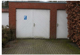
Parkmöglichkeit vor Garage / Geräteraum