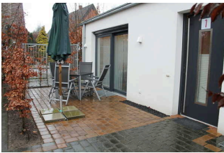
Terrasse mit Gartenmöbeln

Die Terrasse befindet sich vor der Ferienwohnung und hat eine Breite von 265 cm und eine Tiefe von 500 cm. Sie ist mit einer Buchenhecke eingefasst. Die Oberflächenbeschaffenheit ist erschütterungsarm, leicht begeh- und befahrbar. Die Pflasterung ist farblich vom Gehweg abgesetzt.