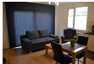
Wohnraum mit Küchenzeile