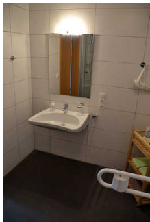
Sanitärraum mit Dusche und WC