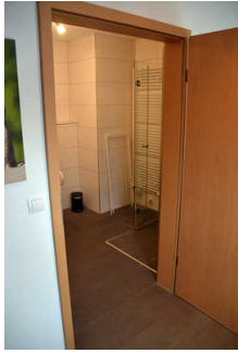
Sanitärraum mit Dusche und WC