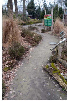
Weg vom Tierpark-Hauptweg zum Ferienhaus-Törchen