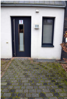
Eingangsbereich Ferienwohnung 1