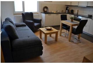
Wohnraum mit Küchenzeile