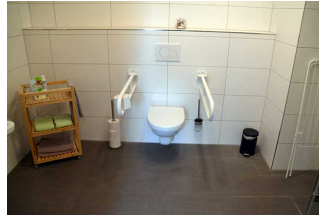
Sanitärraum mit Dusche und WC