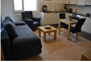
Wohnraum mit Küchenzeile