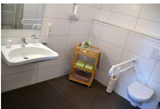
WC, Dusche, Waschraum