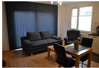
Wohnraum mit Küchenzeile