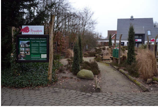
Weg vom Tierpark-Hauptweg zum Ferienhaus-Törchen