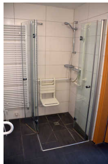
Sanitärraum mit Dusche und WC