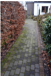
Weg vom Eingangstor bis zur Haustür