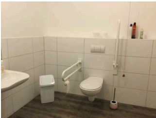
WC für Menschen mit Behinderung