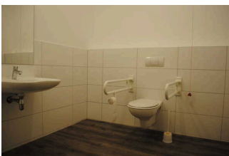
WC für Menschen mit Behinderung