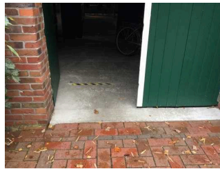
Eingang Café / Veranstaltungsraum