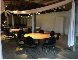
Speiseraum / Café / Veranstaltungsraum