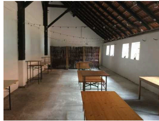
Speiseraum / Café / Veranstaltungsraum