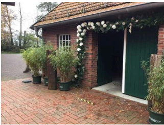
Eingang Café / Veranstaltungsraum