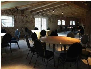
Speiseraum / Café / Veranstaltungsraum