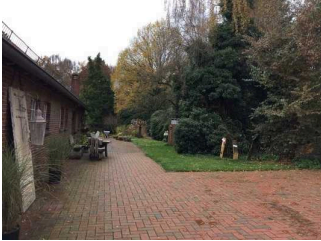
Weg außen Führung durch den Bauerngarten