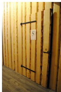
Tür zum WC für Menschen mit Behinderung