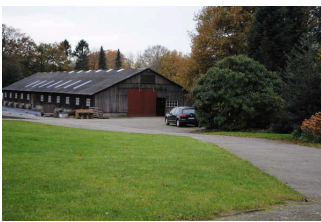
Weg vom Hof zur Baumschule