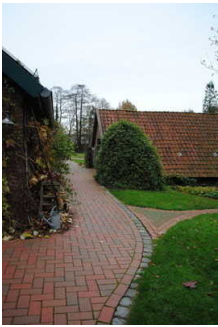
Weg im Garten

Es werden Führungen für Menschen mit Gehbehinderung angeboten.