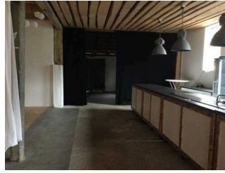
Speiseraum / Café / Veranstaltungsraum