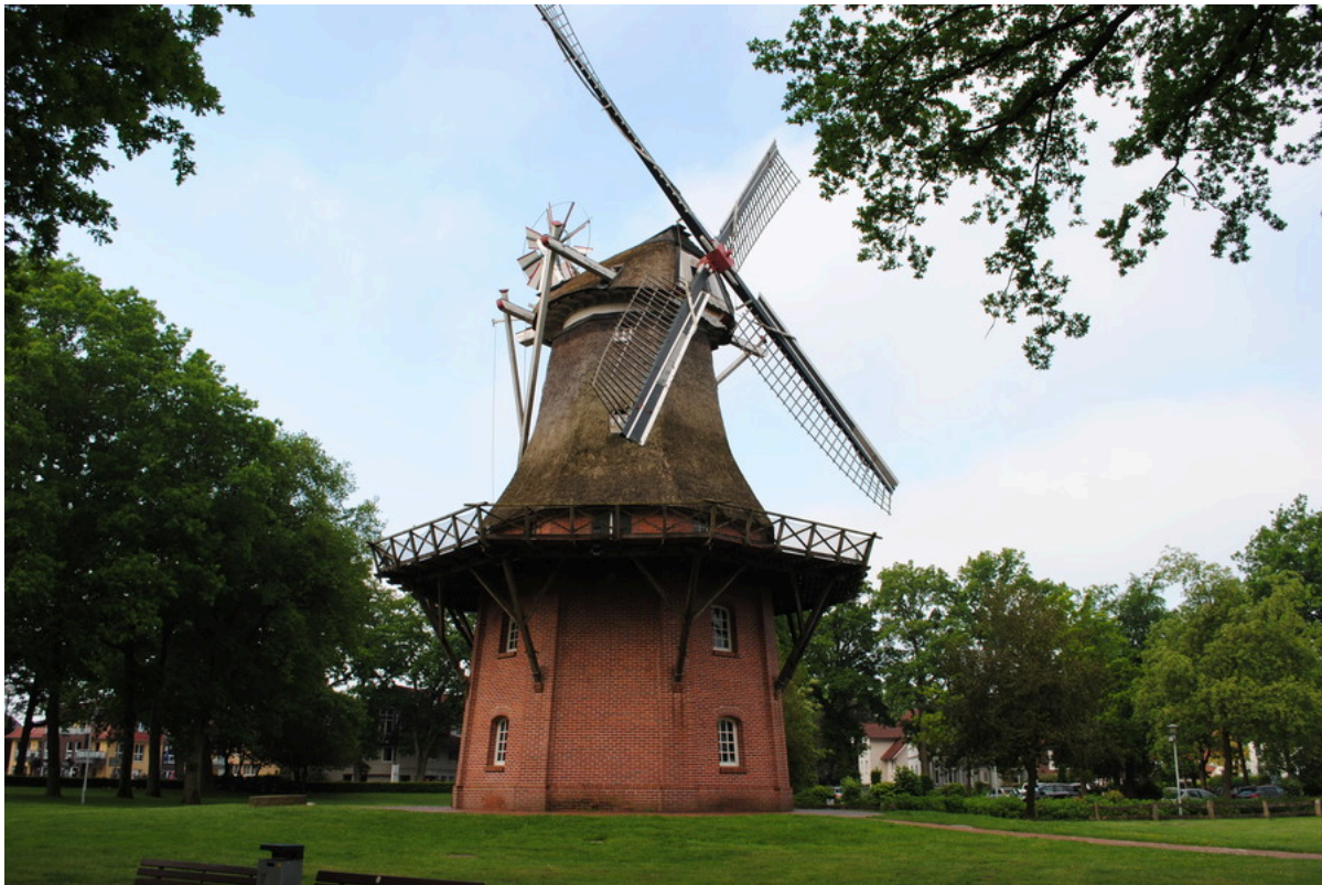
Gästeführung "Spaziergang durch Bad Zwischenahn"