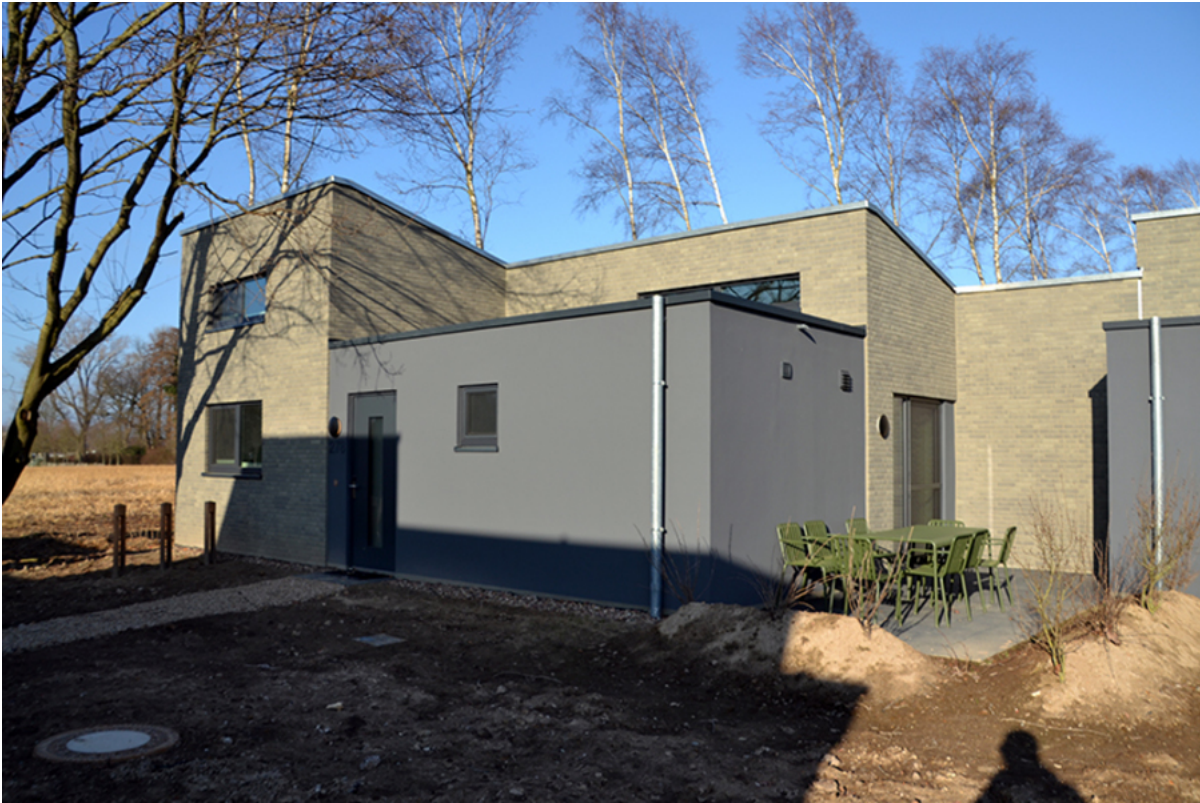
Marissa Ferienpark Haus M – DDS278