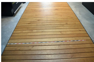
Wege durch die Ausstellung