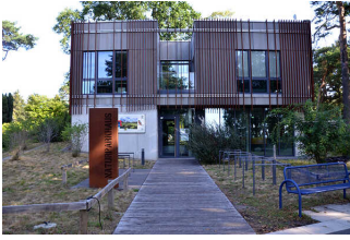
Weg vom See