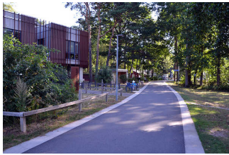
Uferweg (Steinhuder Meer Rundweg)