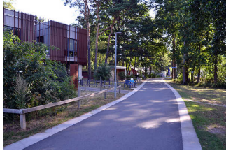
Uferweg (Steinhuder Meer Rundweg)