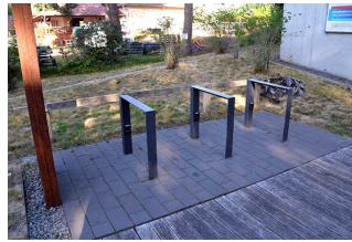
Fahrradständer mit Ladesteckdosen