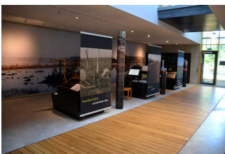
Wege durch die Ausstellung