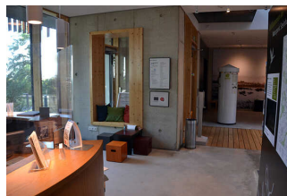
Wege durch die Ausstellung