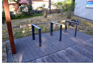
Fahrradständer mit Ladesteckdosen