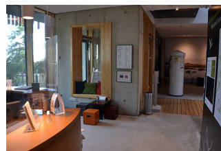
Wege durch die Ausstellung