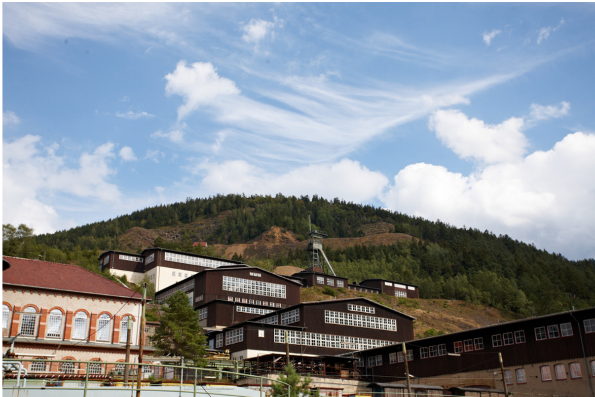
Gesamtansicht Weltkulturerbe Rammelsberg