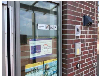
Bedienelemente / Leitsystem