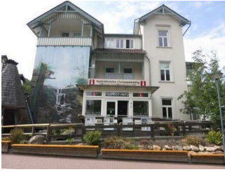
Tourist-Information Bad Harzburg