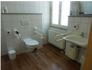
barrierefreies WC in Tourist-Information