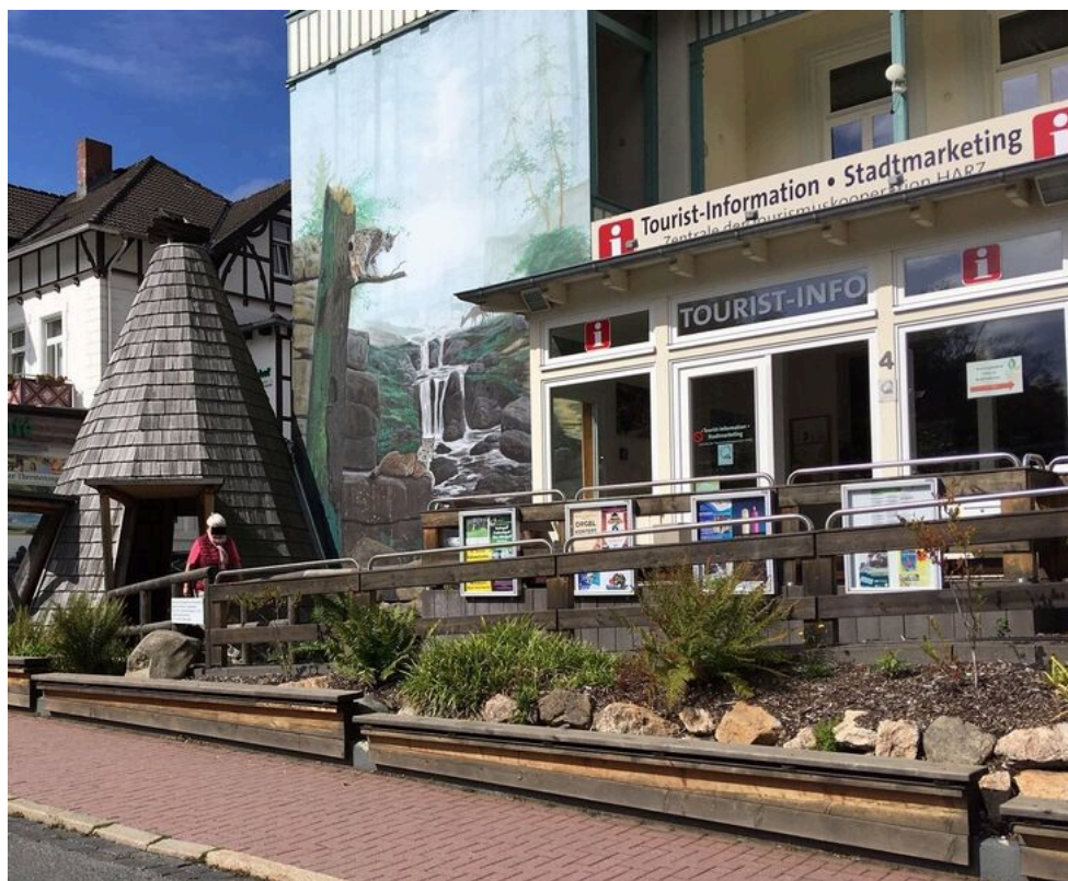
Tourist-Information Bad Harzburg