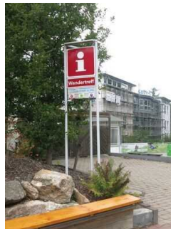
Bedienelemente / Leitsystem