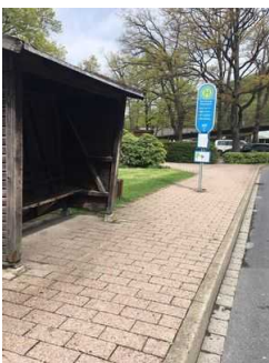
Bussteig Burgberg- Seilbahn