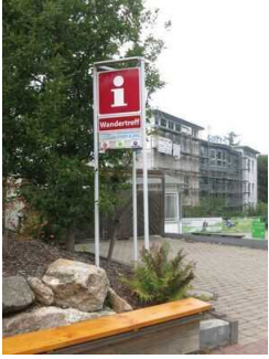
Bedienelemente / Leitsystem