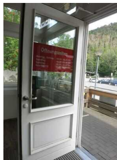
Mantelbogen visuell taktile Gestaltung

Die Bedienelemente (z.B. Türgriffe, Lichtschalter, Notruftaster) sind im gesamten Gebäude/Objekt taktil erfassbar.