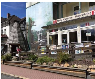
Tourist-Information Bad Harzburg