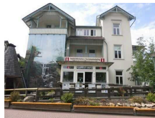
Tourist-Information Bad Harzburg