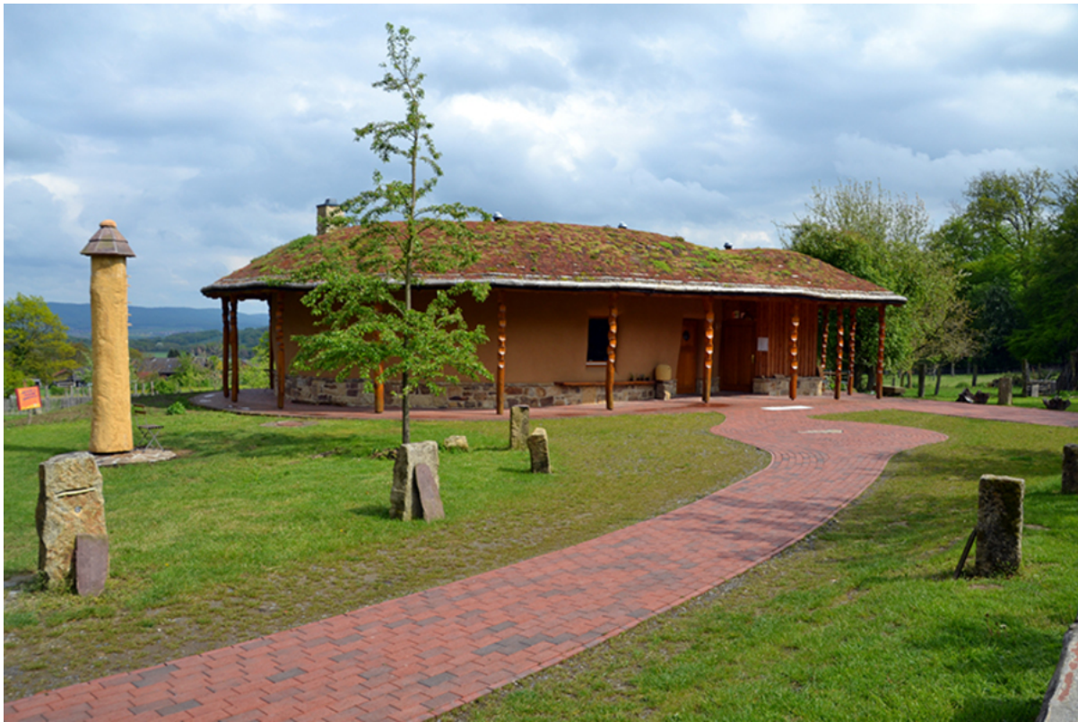
Das Bienenhaus der "Schaumburger Waldimkerei"