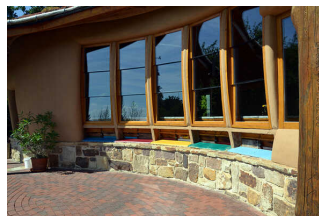
Rundweg um das Bienenhaus