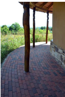
Rundweg um das Bienenhaus