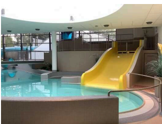
Rutsche im Erlebnisbecken