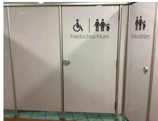
Umkleide und Dusche für Menschen mit Behinderung