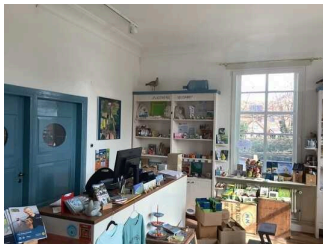
Kasse / Shop Ebene 2