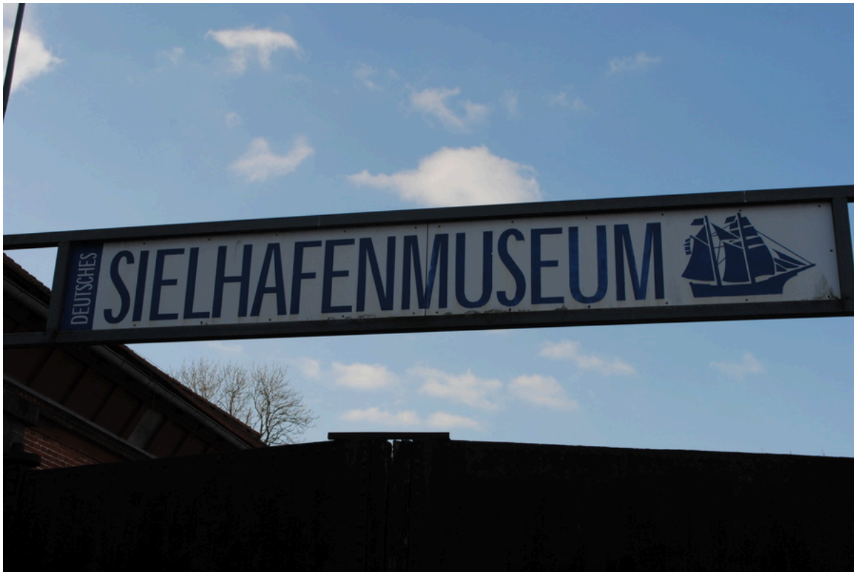
Schild an der Einfahrt