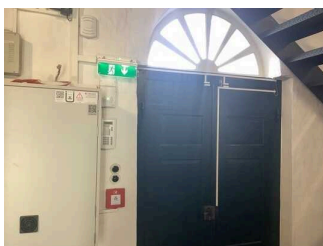
Technische Hilfsmittel / Alarm