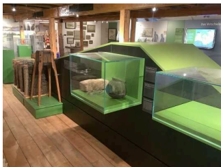
Ausstellung "Harlebucht" – Ebene 3