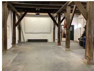
Veranstaltungsraum – Ebene 1