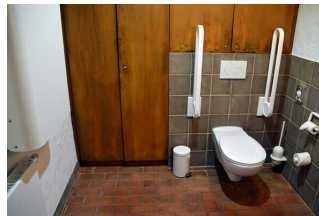
Öffentliches WC "Vilser Gerüchteküche"