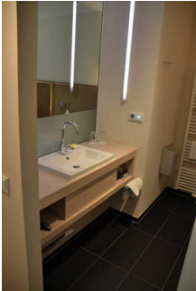
Zimmer 7 Klostermühle (Standard)