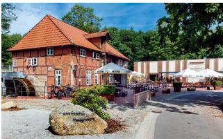
Restaurant "Vilser Gerüchteküche"