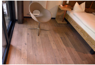
Zimmer 7 Klostermühle (Standard)