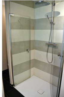
Zimmer 7 Klostermühle (Standard)