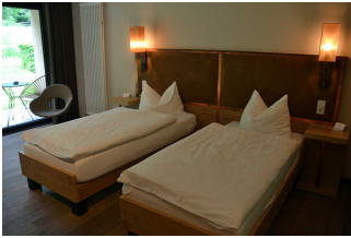
Zimmer 7 Klostermühle (Standard)