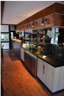
Restaurant "Vilser Gerüchteküche"