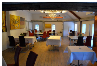
Tagungsraum "Vilser Gerüchteküche"