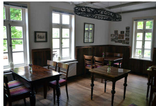
Restaurant "Vilser Gerüchteküche"