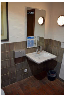
Öffentliches WC "Vilser Gerüchteküche"