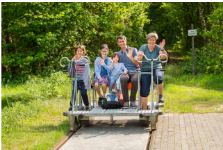
Fahrgeschäft / Draisine