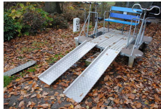
Fahrgeschäft / Draisine