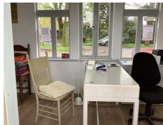
Schalter / Kassentisch