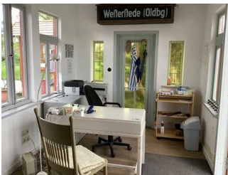
Schalter / Kassentisch